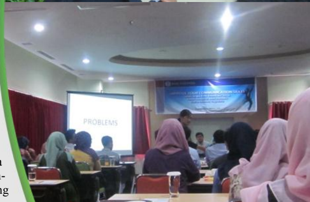
Pelatihan Kepada para Surveyor Bank Indonesia

Dengan diselenggarakannya pelatihan ini diharapkan kualitas berkomunikasi surveyor BI akan meningkat sehingga para surveyor bisa mendapatkan data yang lebih baik. Data yang lengkap dan mendalam sangat tergantung pada surveyor dalam proses mewawancarai. Tentu data tersebut sangat penting bagi BI untuk mengetahui kondisi yang sebenarnya serta dalam mengambil keputusan yang terkait dengan hasil yang didapatkan.