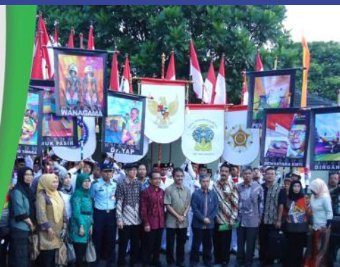
Event Festival Museum 2013

Dengan adanya festival museum tersebut, diharapkan seluruh masyarakat Indonesia dapat mengenal sejarah bangsa, khususnya kepada kalangan generasi muda atau mahasiswa untuk lebih mencintai keberadaan museum dan dapat lebih memahami hal-hal terbaik dari bangsa kita di museum.