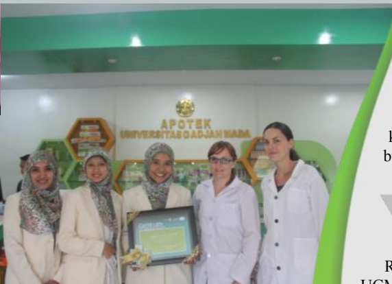
Mahasiswa Asing Lakukan Praktek Kerja di Rumah Sehat dan Apotek UGM

Rumah Sehat dan Apotek UGM merupakan unit usaha Gama Multi Group yang berkonsep unik karena selain memberikan pelayanan kesehatan, Rumah Sehat & Apotek UGM mengembangkan konsep apotek pendidikan, dimana Rumah Sehat & Apotek UGM dapat dipergunakan sebagai tempat praktek kerja/magang bagi para mahasiswa baik dari universitas dalam negeri maupun dalam negeri.