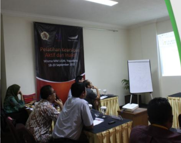
Pelatihan Kearsipan Aktif dan Inaktif Gama Konsultan

Gama Konsultan sebagai salah satu unit bisnis Gama Multi Group selalu aktif mengadakan pelatihan-pelatihan di berbagai bidang secara rutin dan terpadu dengan mengundang praktisi dan tenaga ahli pada bidangnya. Salah satu pelatihan terbaru dari Gama Konsultan adalah pelatihan kearsipan, selain pelatihan master of ceremony , contract drafting , manajemen, building management , dan protokoler.