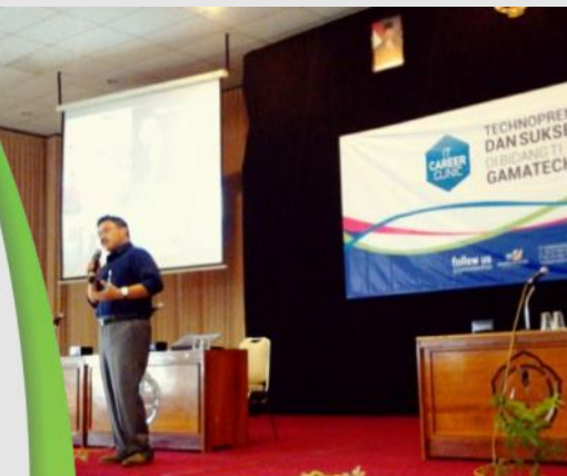
Gamatechno Selenggarakan Program IT Career Clinic di beberapa Perguruan Tinggi Yogyakarta