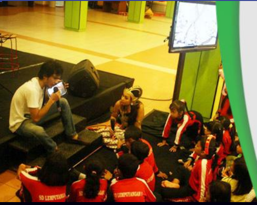
Kegiatan Pekan Wisata Nasional yang dilakukan oleh Swaragama