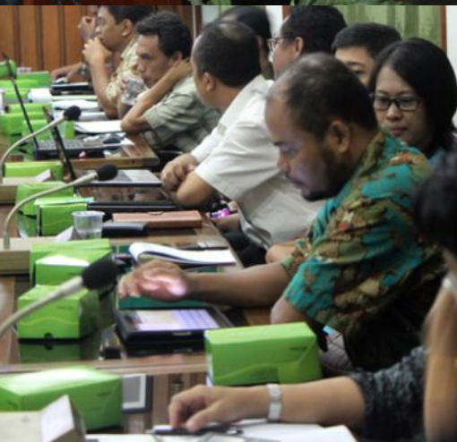
Gama Konsultan Kerjakan AMDAL Beberapa Hotel di Yogyakarta