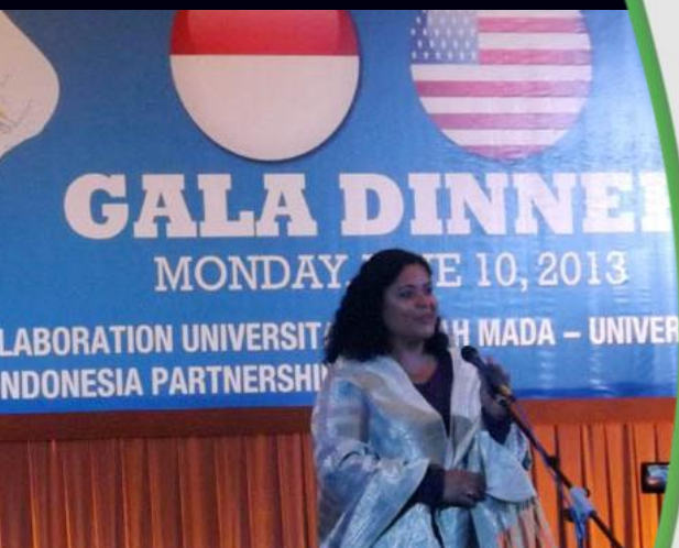
Penyelenggaraan event-event internasional oleh University Club Hotel & Convention