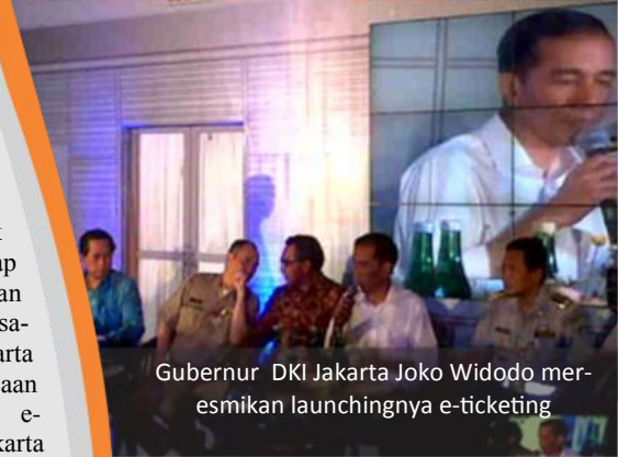
Gubernur DKI Jakarta Joko Widodo meresmikan launchingnya e-ticketing