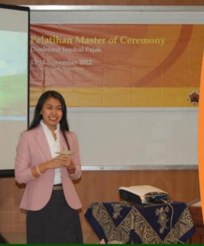
Pelatihan Master of Ceremony diselenggarakan oleh Gama Konsultan

Website Gama Konsultan www.gamakonsultan.com