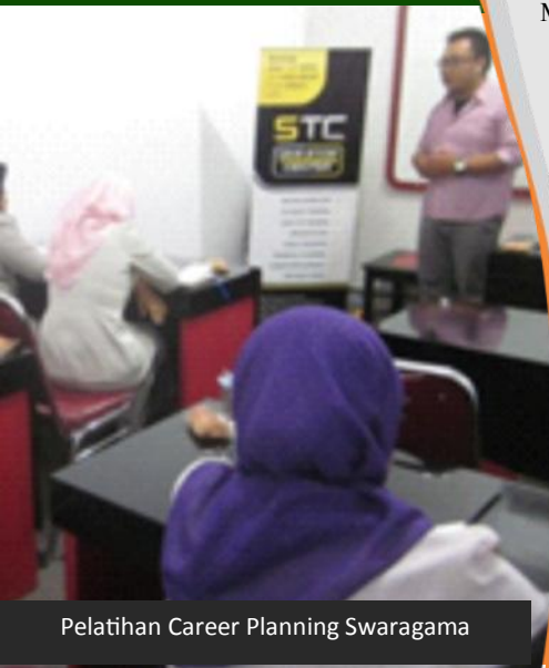
Pelatihan Career Planning Swaragama