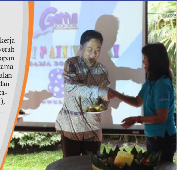
Ulang tahun PT Gama Book Store pada tanggal 12 Februari 2013

sukses, bergerak maju, bekerja keras, dan pantang menyerah dengan tujuan dan harapan menjadi perusahaan utama dalam bidang penjualan peralatan tulis sekolah dan perkantoran serta perlengkapannya (Office Equipment), media informasi, komputer, buku, barang cetakan serta mampu menjadi pelopor perusahaan penyedia produk 'tangan kedua' yang profesional, berdaya saing tinggi, mengedepankan kualitas, dan prinsip keberlanjutan.